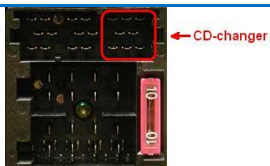
Рис.2.2. Разъем магнитолы (тип А, 8-pin Mini-ISO)

Внимание: если в бардачке, подлокотнике или багажнике машины установлен внешний штатный 6-дисковый CD-чейнджер, то при подключении адаптера от него придется отказаться. CD-проигрыватель, встроенный в головное устройство, сохраняется.