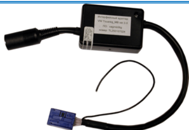
Рис.1. Адаптер VAG-AUX (12pin)

Интерфейсный адаптер VAG-AUX (рис.1 – изображение схематично) предназначен для подключения к штатной магнитоле автомобиля Audi, VW, Skoda, Seat. Магнитола должна уметь управлять внешним штатным CD-чейнджером и иметь для этого соответствующий интерфейс и разъем (рис.2.1 или рис.2.2).