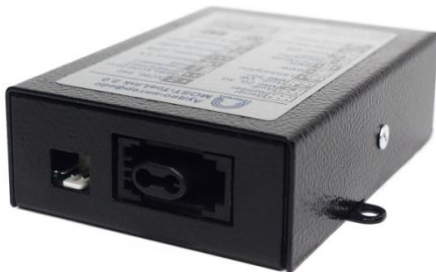
Адаптер MOST- AiNet 2.0 (разъем питания и разъем MOST с заглушкой)