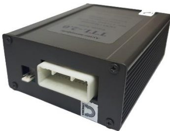
Рис.1. Адаптер TTL-2.1 (сторона с разъемом 24pin)