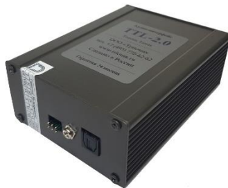
Рис.2. Адаптер TTL-2.1 (сторона с разъемом TosLink)