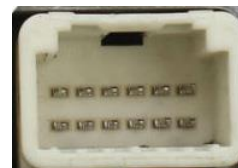
Рис.4. Разъем на штатном усилителе «Toyota 6+6»