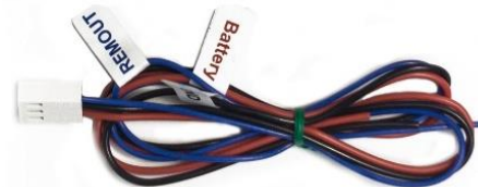
Рис.2. Кабель питания