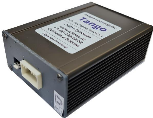
Рис.1. Адаптер Tango