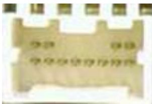
Рис.2. Разъем Nissan (4+8)

Для некоторых магнитол Nissan при подключении, возможно, придется перебрать разные положения перемычек. «По умолчанию» они установлены в «Variant-1». Проверьте адаптер при таком положении. Если работа некорректная, то надо изменить их позицию.